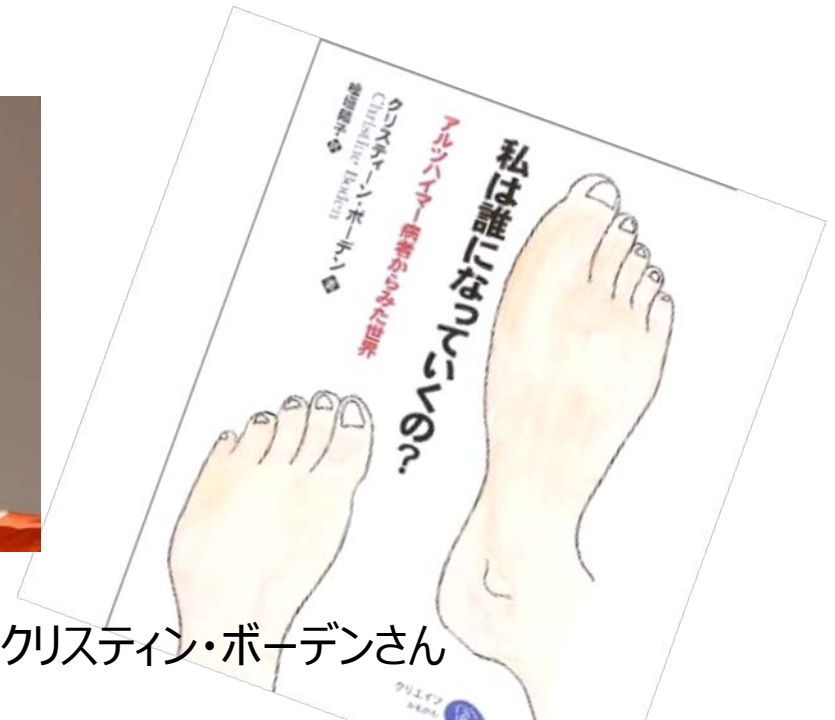
2012年(63歳) 沖縄県名護市での講演にて クリスティン・ボーデンさん